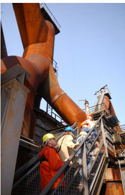
Aufstieg zur Gichtbühne