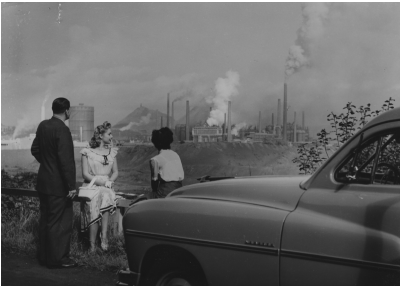
Blick auf die Völklinger Hütte, 1950er Jahre