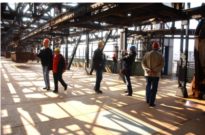
Industriekultur: Besucher:innen auf der Gichtbühne